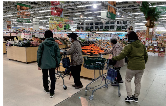
〈基準緩和型通所サービスあゆみ お買い物体験会〉