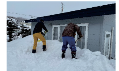
〈サポートクラブにじまー〉