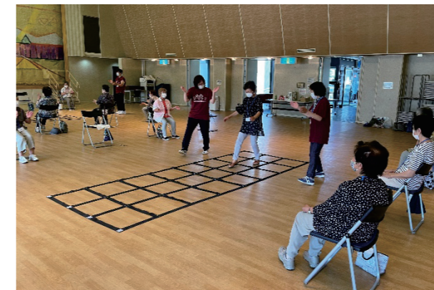
〈ふまねっと運動教室〉