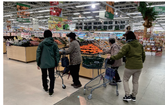
〈基準緩和型通所サービスあゆみ お買い物体験会〉