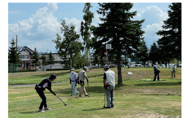
〈老人クラブ連合会パークゴルフ大会〉