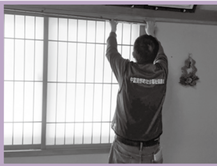
カーテンレールの取付